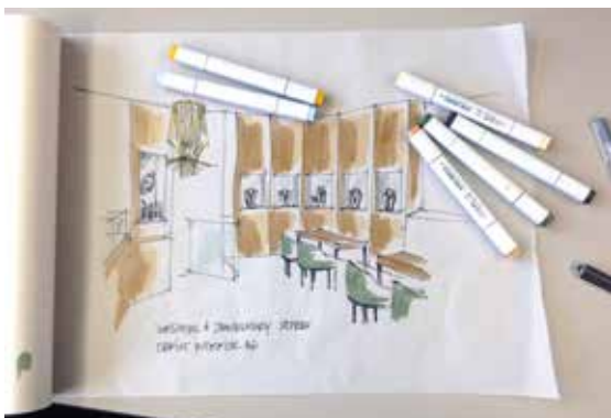
Ein neues Ladenlokal entsteht erst auf Papier.

Mit einer über hundertjährigen Erfolgsgeschichte kann das Obrist-Team im Bereich Luxusladenbau auf einen wertvollen Wissensschatz zurückgreifen. So werden optimale Bedingungen für den Bijoutier und für dessen Kunden geschaffen, für die das Einkaufen zum Erlebnis werden soll. Grundwerte wie Vertrauen und Flexibilität sind selbstverständlich. Aber auch das Thema Nachhaltigkeit, das heutzutage in aller Munde ist, wird von der Ladenbaufirma ernst genommen. „Hier habe ich hochmotivierte Mitarbeiterinnen und Mitarbeiter angetroffen und bin glücklich, in einem Team mitwirken zu dürfen, das zukunftsorientiert arbeitet und verantwortungsvoll mit den Ressourcen umgeht“, freut sich die junge Chefdesignerin. (red.)